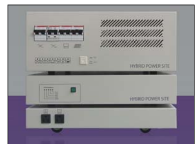
自動切替無停電電源装置