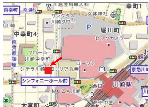
<「三井のリパーク」川崎西口パーキング 地図>