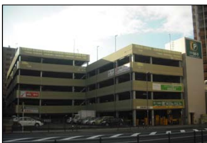
「三井のリパーク」川崎西口パーキング